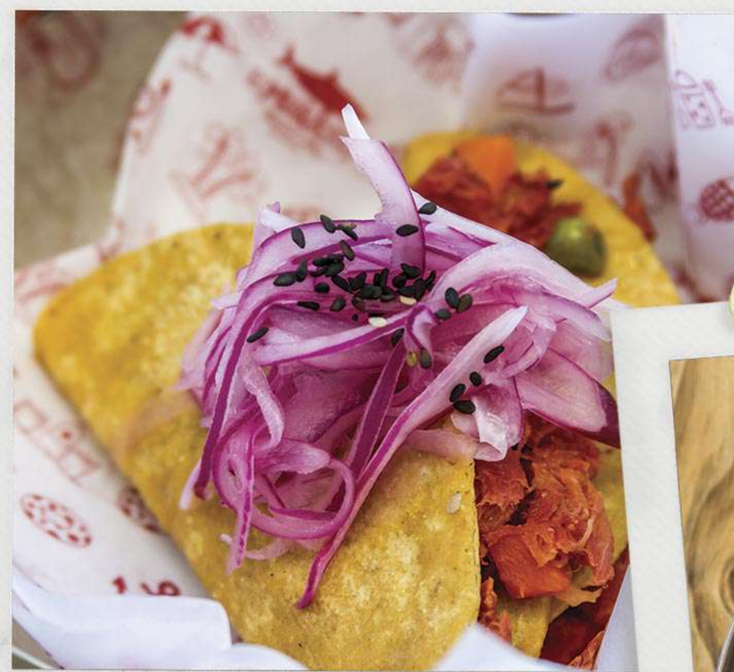
Tacos dorados de atún ahumado

NUEVO/NEW Tacos Baja, tortilla de harina con relleno de camarón al cajún, queso y aguacate Tacos Baja, flour tortilla stuffed with cajun shrimp, cheese and avocado