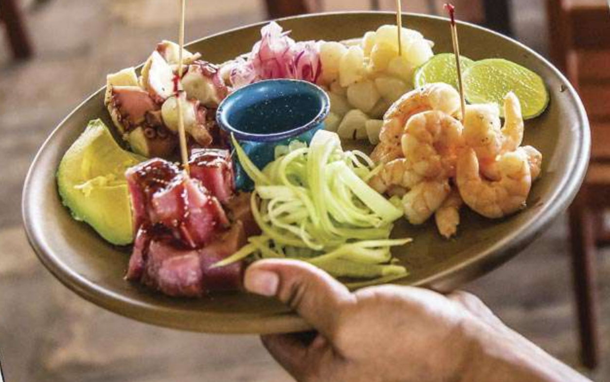
Plato de mariscos para picar