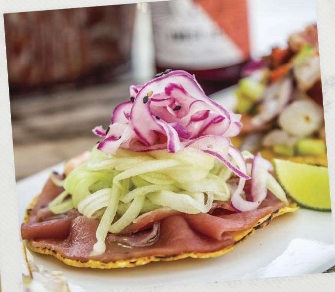
Tostada de carpaccio de atún