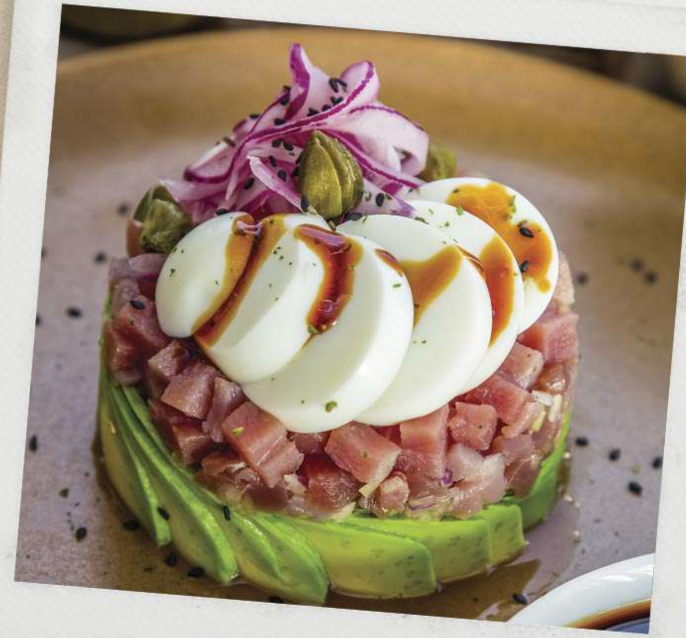
Tártara de atún

NUEVO/NEW Ceviche Maza (camarón cocido, camarón crudo, callo de hacha, pulpo, cebolla morada, pepino y toque de chiltepin) Maza Ceviche (shrimp, scallops, octopus, onion, cucumber and chiltepin)