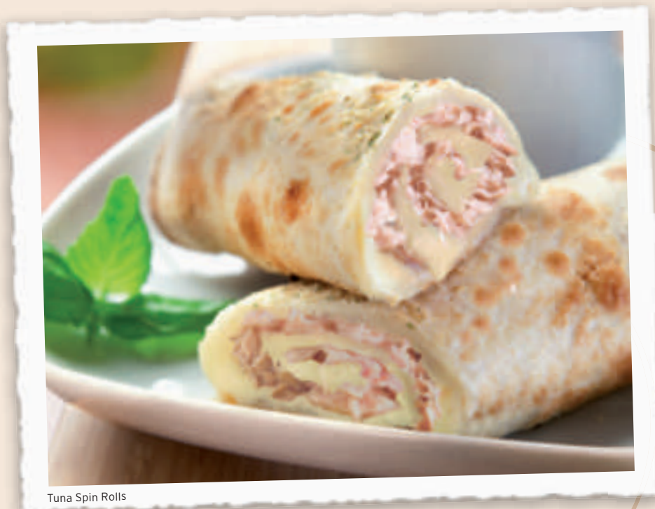
Tuna Spin Rolls