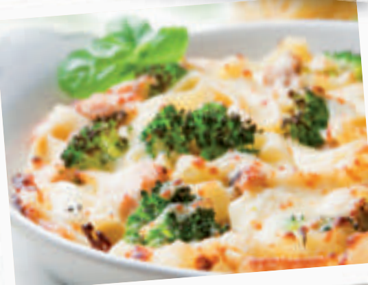
Broccoli Chicken Gratin

So viel Geschmack: Tagliatelle mit frischen Champignons, Blattspinat, Zwiebeln, in Knoblauchcremesauce, leicht überbacken mit Mozzarella.