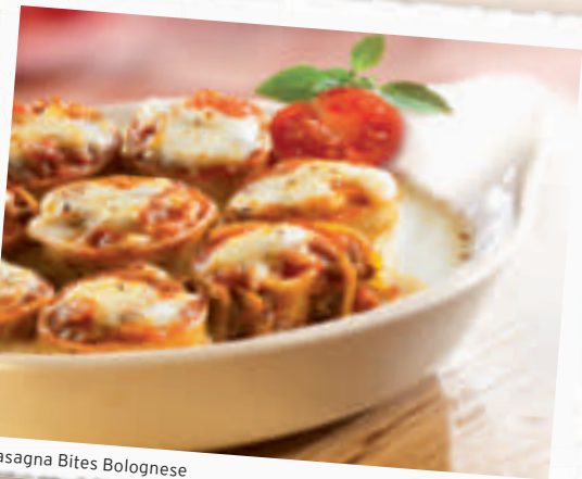
Lasagna Bites Bolognese