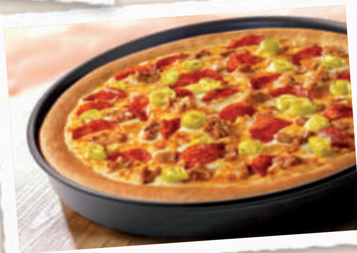
Pan Pizza Spicy Devil