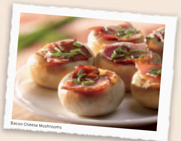
Bacon Cheese Mushrooms

Unschlagbar: frische Champignons mit herrlicher Füllung aus Bacon 1), 3), 6) und jungem Gouda 1) .