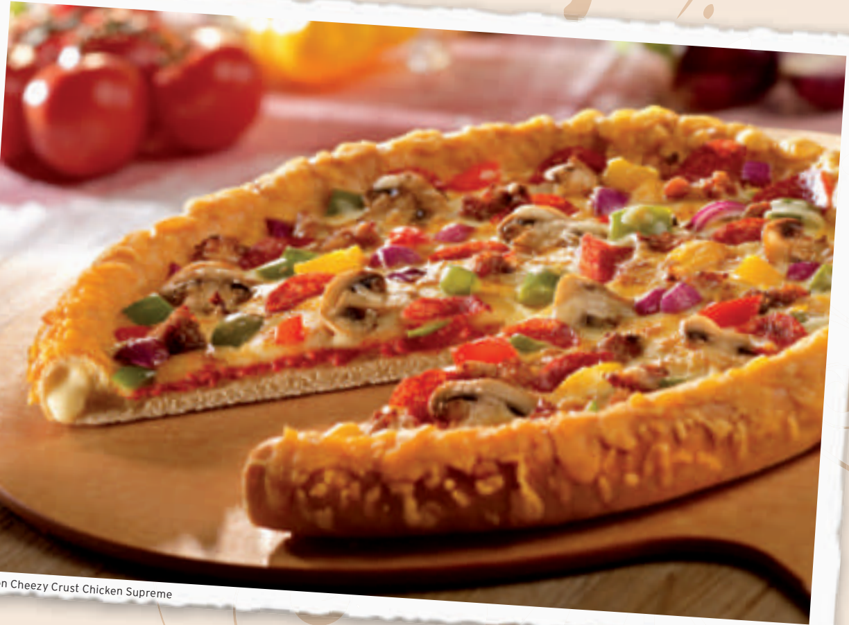
Golden Cheezy Crust Chicken Supreme