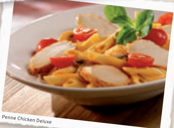
Penne Chicken Deluxe

Penne in lecker-cremiger Käsesauce 3), 6) mit frischen Champignons, saftigen Hähnchenbruststreifen und Cherrytomaten.