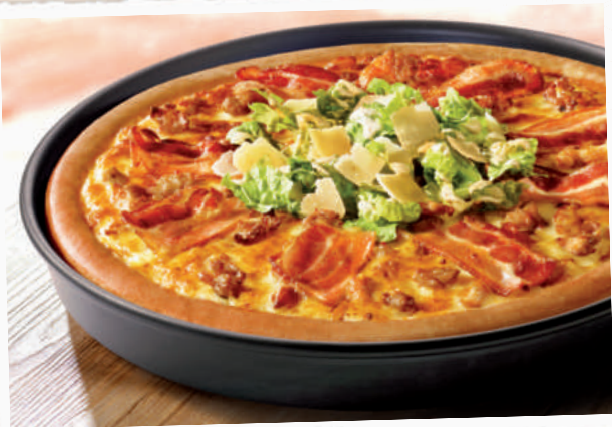
Pan Pizza King Caesar groß

Immer wieder gern gewählt: fruchtig-süßsauer durch Ananas und feinen Schinken 1), 3), 6) .