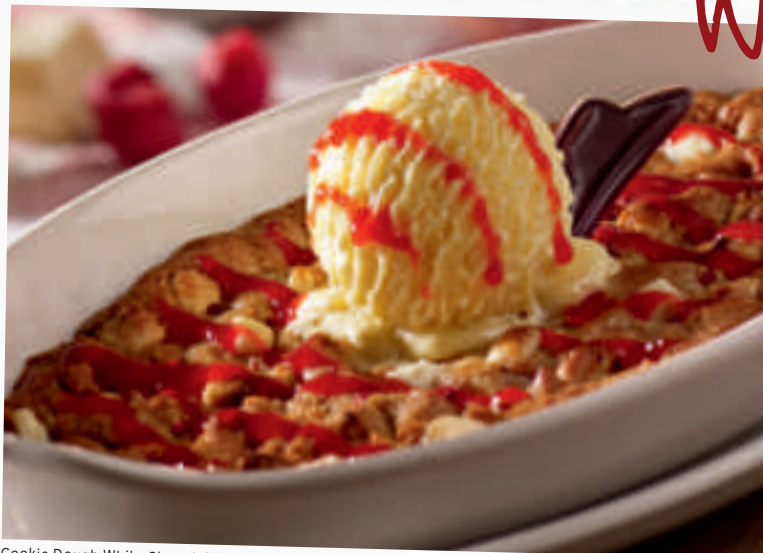
Cookie Dough White Chocolate Raspberry