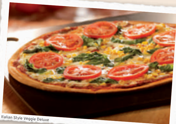
Italian Style Veggie Deluxe

Dips zur Auswahl: Sour Cream • Barbecue 2) • Ketchup • Mayonnaise 1), 2), 3) • Chili Sauce Plus 0,50 €