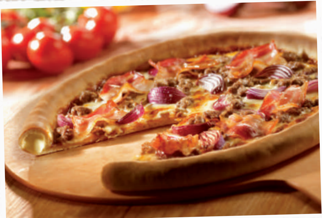
Cheezy Crust Barbecue Lover's

Doppelt hält besser: 2 x herzhaftes Rinderpeperoniwurst 1) für Liebhaber.