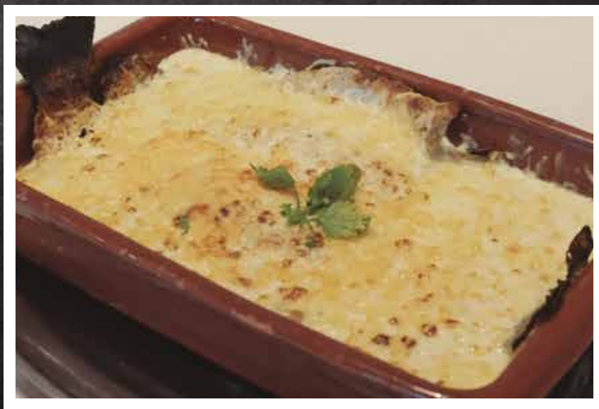
► Truta ao molho de catupiry