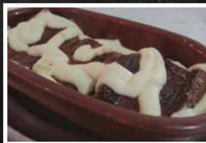
► Filé Mignon ao catupiry