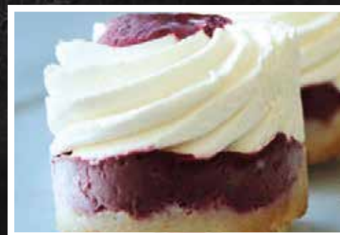
► Charlotte de amora