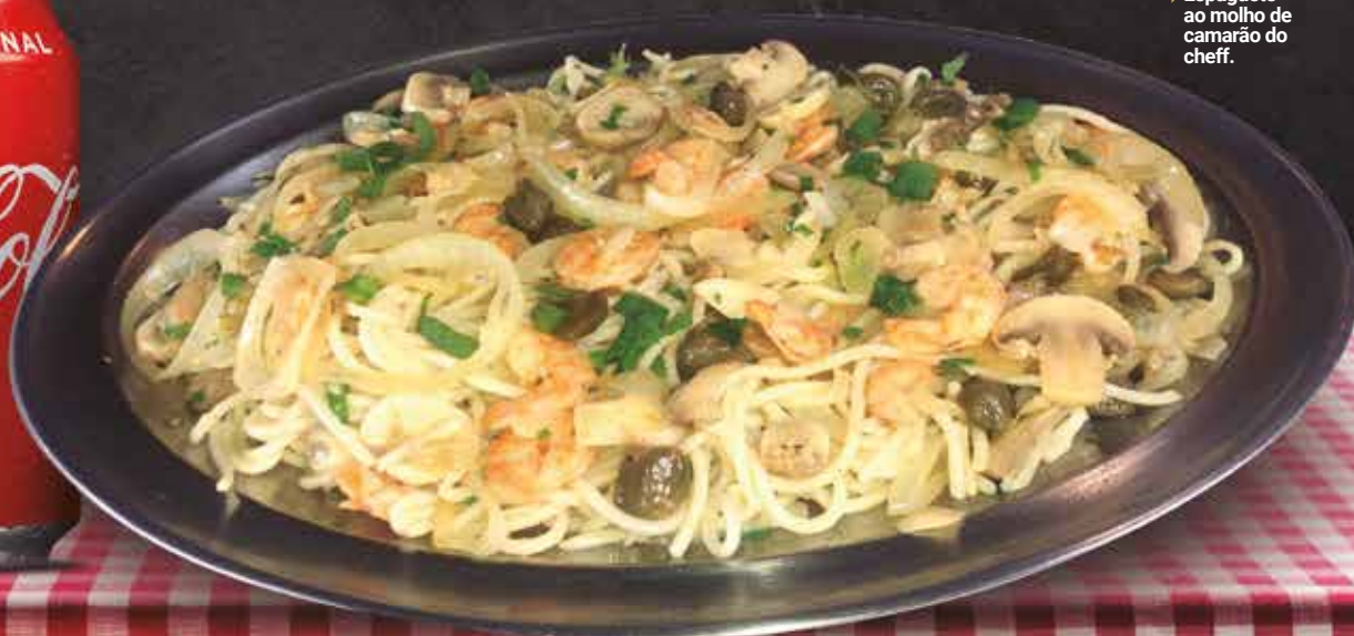
► Espaguete ao molho de camarão do chef.