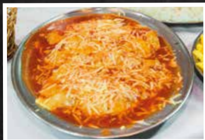
► Filé à Parmegiana