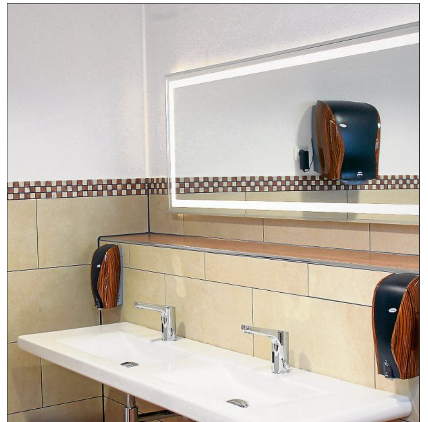
Die Toilettenanlagen wurden grundlegend erneuert und erweitert.